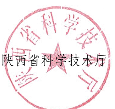
陕西省科学技术厅