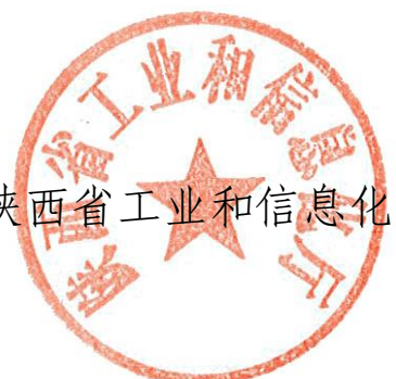
陕西省工业和信息化厅